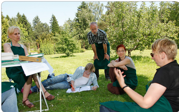
Präsenzveranstaltung im Botanischen Garten

Das interdisziplinäre berufsbegleitende Weiterbildungsangebot an der Universität Rostock richtet sich an Interessierte, die eine Zusatzqualifikation anstreben. Ziel ist, die Teilnehmerinnen und Teilnehmer des Angebots zu befähigen, gartentherapeutische Maßnahmen im beruflichen Alltag mit Klientinnen und Klienten umzusetzen und Konzepte für die Umsetzung von Gartentherapie zu entwickeln.