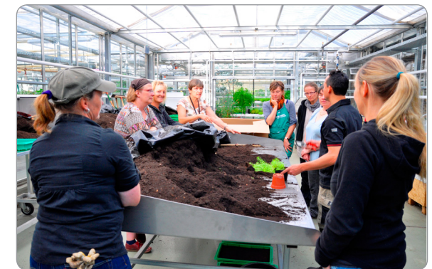
Präsenzveranstaltung in der Agrarfachschule des Landes M-V

Aktuelle Bewerbungsfristen, notwendige Unterlagen, weitere Informationen zu Rahmenbedingungen und Inhalten der Module finden Sie im Internet auf der Seite www.weiterbildung.uni-rostock.de/zertifikatskurse/ .