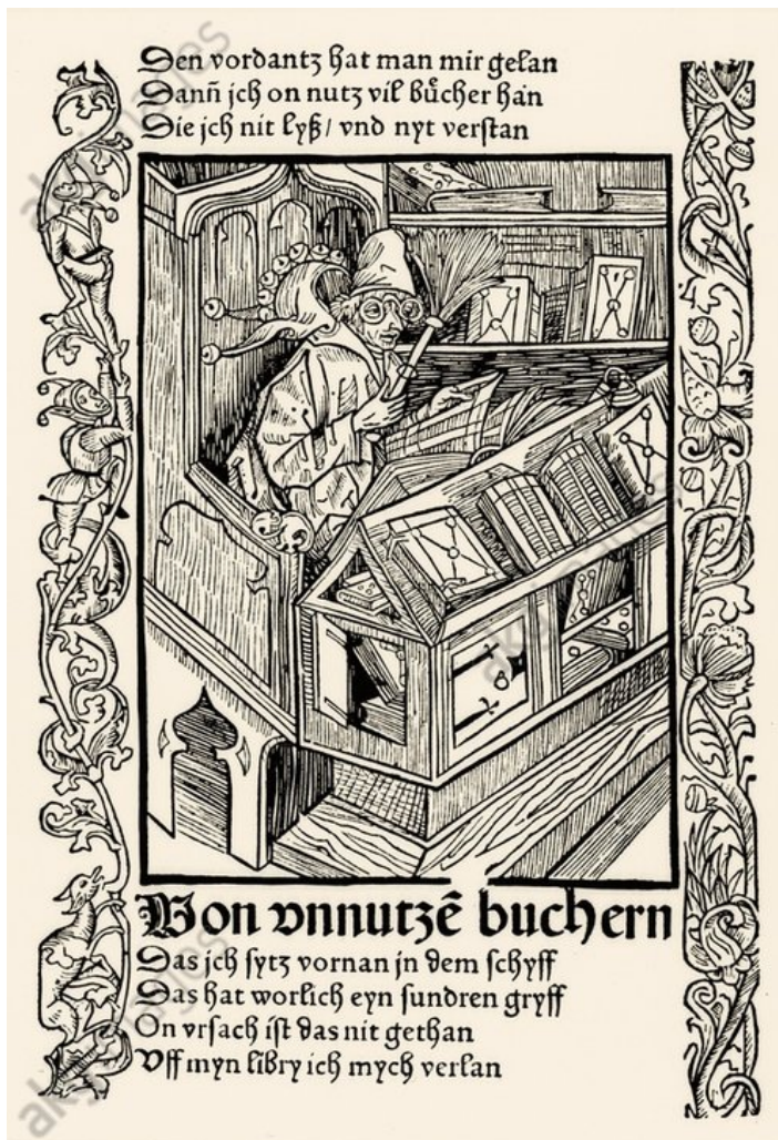
Büchernarr, Holzschnitt aus S. Brant: Narrenschiff, 1494.

Die produktive Auseinandersetzung mit Fachliteratur ist eine der grundlegenden Voraussetzungen geschichtswissenschaftlicher Arbeit. Die Literaturrecherche ist ein kreativer Prozess, für den es keinen „Standardweg“ gibt: Je nach Thema, Fragestellung und Literaturlage ergeben sich unterschiedliche Recherchestrategien. Die folgenden Hinweise können als erster Einstieg dienen.